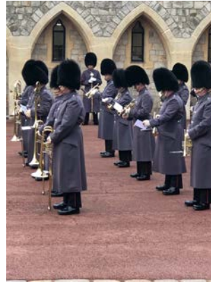
在溫莎城堡看到的交接儀式