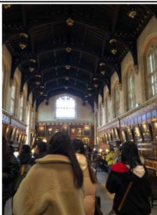
哈利波特拍攝場景(基督堂)