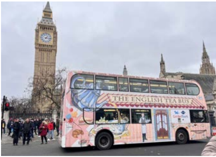
很特別的下午茶車