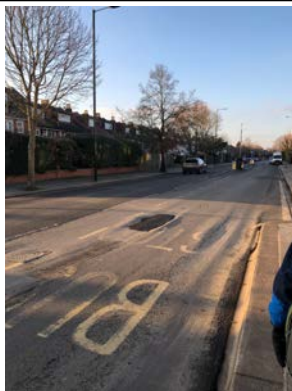
每天放學等巴士的地方