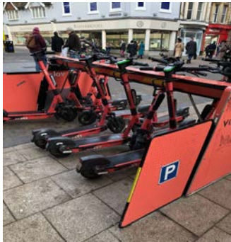
在Oxford city centre 看到有人騎這個，很酷