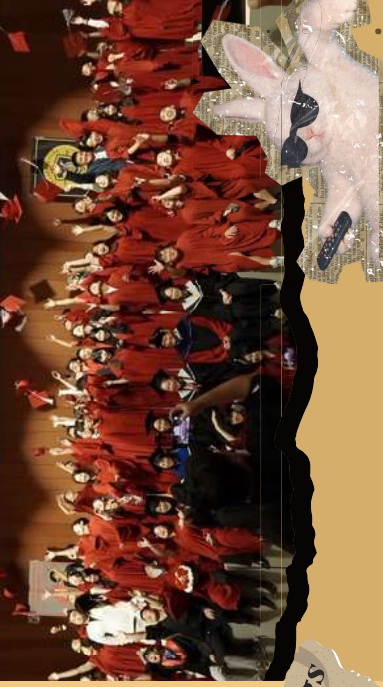
good things take times