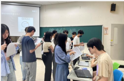
虛擬人生遊戲-買股票