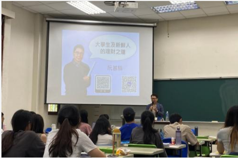
產業研究成果發表會